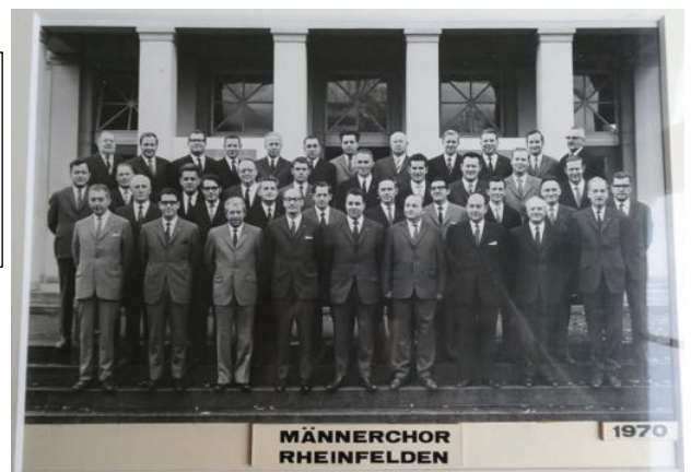
Nr. 23 >