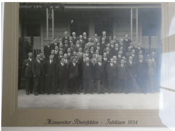
Nr. 22 <