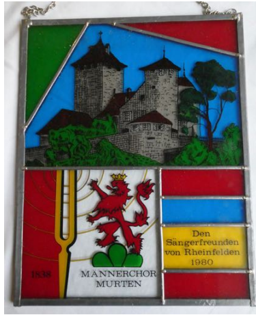
Nr. 17: MC Murten an MCR 1980