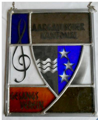
Nr. 21: 150 Jahre MC Schupfart 1846-1996.